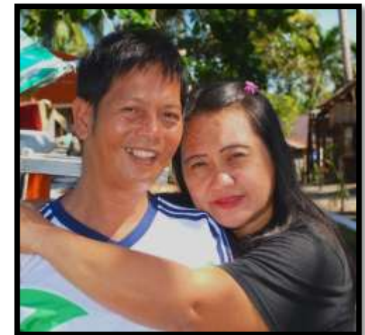
Maraming nagsasabi mas masaya ang pagtatalik pagkatapos